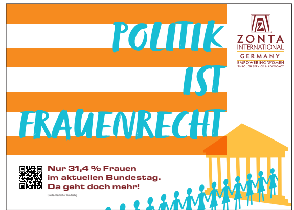
PDF-Vorlagen für Postkarten in Din A6, Thema Bundestag