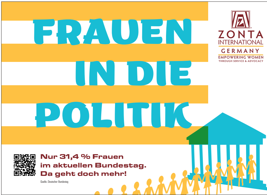
PDF-Vorlage mit dem Thema Bundestag in Din A2 Querformat