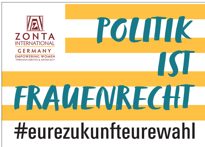
PDF-Vorlage für rechteckige Outdoorsticker DIN A7 (7,4 x 10,5 cm)

Geeignet z.B. für die Anbringung auf Schriftstücken