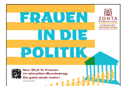
PDF-Vorlage mit dem Thema Bundestag in Postkartenformat Din A6 Querformat