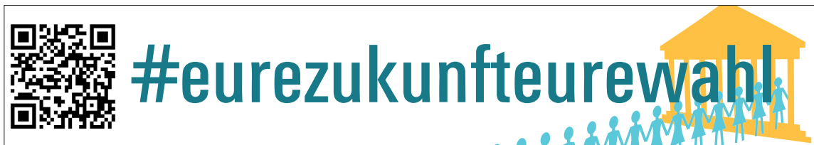
PDF-Vorlage für rechteckige Indoorsticker 21,0 x 3,5 cm