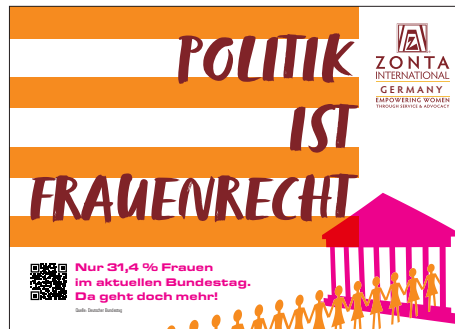
PDF-Vorlagen mit dem Thema Bundestag in Din A4 Querformat