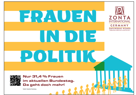
PDF-Vorlage mit dem Thema Bundestag in Din A4 Querformat