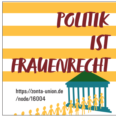
PDF-Vorlage für quadratische Indoorsticker 5 x 5 cm (z.B. auf der Rolle)