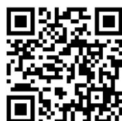
QR-Code im Format png, jpg und tiff